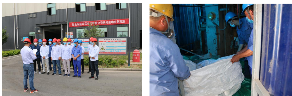
图 3-3 飞灰泄漏演练图片

公司生产过程中使用到的原辅材料中涉及的环境风险物质主要包括酸、碱、氨水、渗滤液、飞灰等，涉及的环境风险源主要包括酸碱加药区、氨区、渗滤液处理站、飞灰固化区等。为了确保环境安全，保障企业员工和周边居民安全与健康，依据《突发环境事件应急预案管理暂行办法》、《企业事业单位突发环境事件应急预案备案管理办法》、《企业突发环境事件风险评估指南》等文件的要求，根据生产规模的变化，公司于 2018 年 04 月《临泉皖能环保电力有限公司突发性环境事件应急预案》，报送临泉县生态环境分局备案。2020 年 05 月 29 日开展厂内飞灰泄漏应急演练。