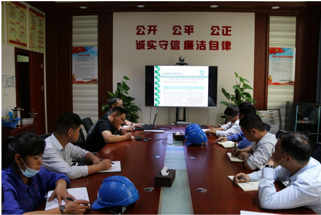
图 3-2 环保培训图片