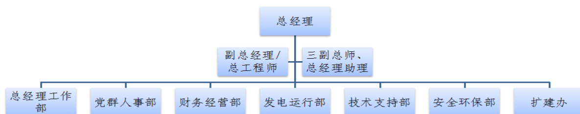
图 2-1 公司组织机构图

2020 年公司全年实现发电 1.9 亿千瓦时，销售收入 12469 万元。公司组织机构见图 2-1