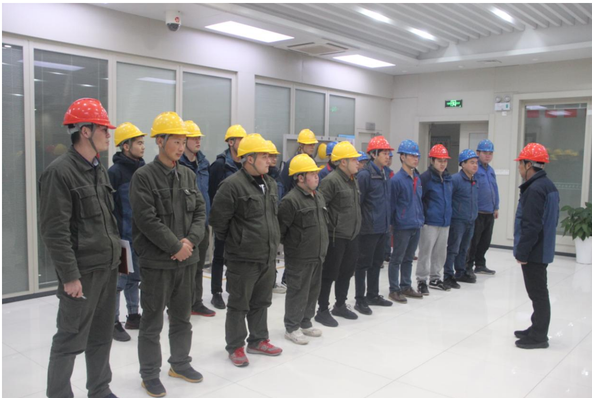
图 5-1 开展危化品专项安全检查

依据《危险化学品名录》进行辨识，公司在生产过程中会使用到酸、碱、氨水等危险化学品，公司制定《危险化学品管理制度》对危险化学品的购买、发放、保管进行规范化管理，对硫酸罐区、氨水罐区按重大危险源进行管理，定期组织安全检查，上报各类隐患并落实整改，使各类危化品处于可控状态。