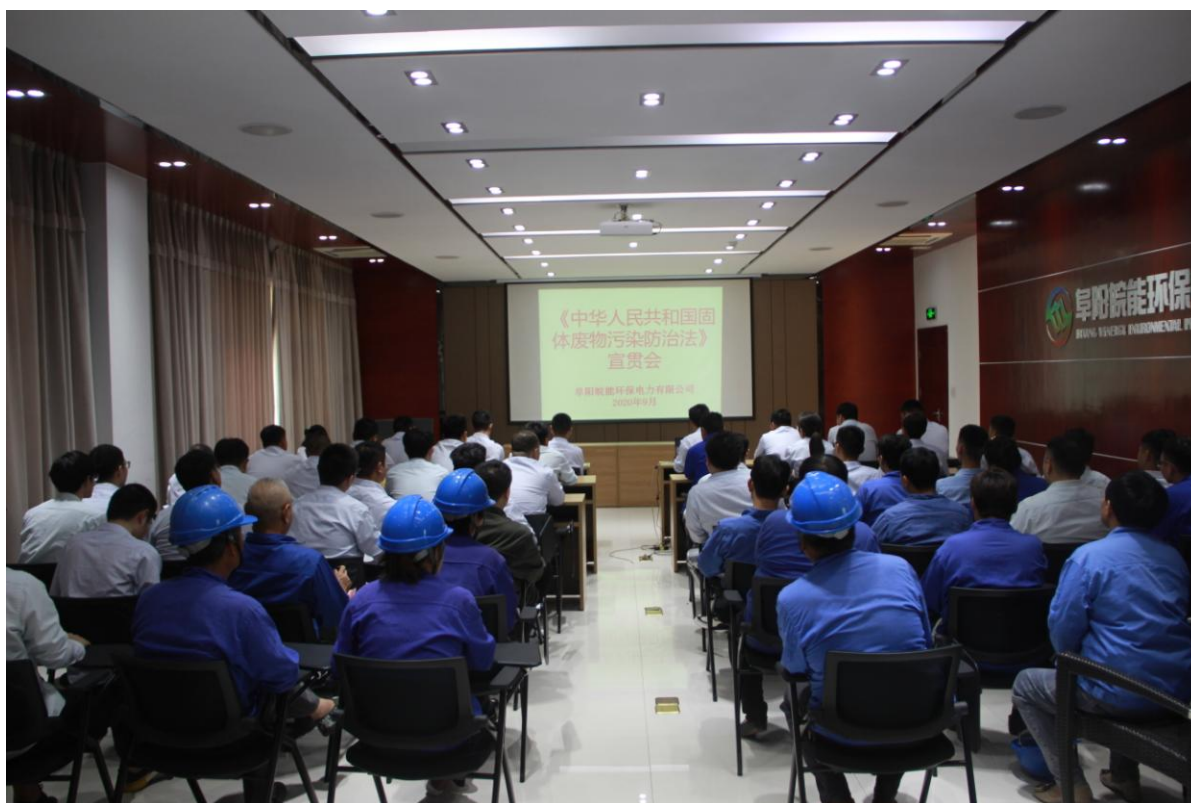
图 3-2 环保培训图片

染防治法》(2020年9月1日实施)宣贯为契机,组织公司全员开展了环保培训,并针对班组长、生产一线人员开展了自动监测数据标记规则培训。对环保管理法律、法规及日常管理进行了专业的讲授,极大的提高了职工的环保管理水平,丰富专业知识。