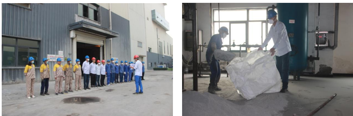
图 3-3 飞灰泄漏演练图片

要包括酸、碱、氨水、渗滤液、飞灰等，涉及的环境风险源主要包括酸碱加药区、氨区、渗滤液处理站、飞灰固化区等。为了确保环境安全，保障企业员工和周边居民安全健康，依据《突发环境事件应急预案管理暂行办法》、《企业事业单位突发环境事件应急预案备案管理办法》、《企业突发环境事件风险评估指南》等文件的要求，根据生产规模的变化，公司于 2020 年 03 月修订了《阜阳皖能环保电力有限公司突发性环境事件应急预案》，并邀请专家对应急预案进行评审，报送颍东区生态环境分局备案审批。2020 年 07 月 03 日开展厂内飞灰泄漏应急演练。